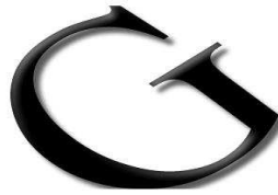
Glauco Mendes Advogados Associados

atendendo o princípio da razoabilidade e da economicidade para a Administração.